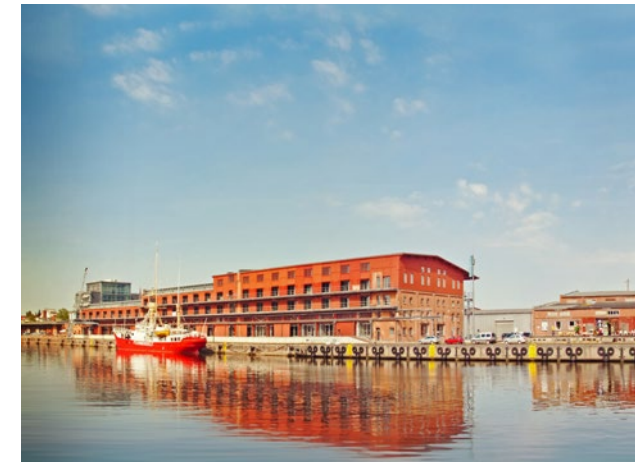
Media Docks in Lübeck